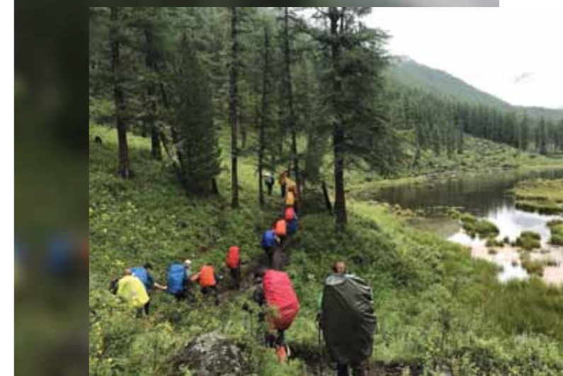
В дождевиках, с цветными чехлами на рюкзаках группа походила на конфетки M&M's

Преодолев 14 км и набрав ещё полкилометра высоты, мы остановились у Шавлинского озера, окружённого горами. Его питают тающие ледники, и их муть придаёт воде ярко-бирюзовый цвет. Даже в серой хмари дождя это волшебное. >