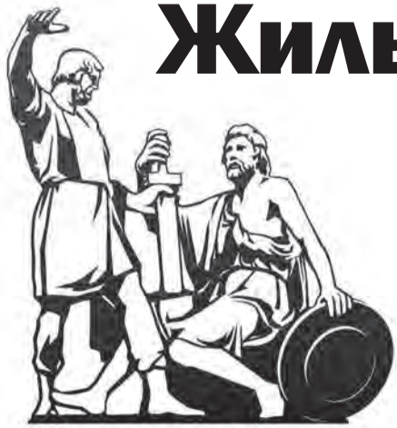
Общественная палата Российской Федерации

Малозэтажные дома, безопасные прозрачные входные группы, отдельное помещение для колясок - район создан для молодых семей. Делегацию форума «Сообщество» проект заинтересовал - гости не выпускали из рук телефоны, делая фото.