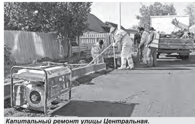
Капитальный ремонт улицы Центральная.

Нельзя не упомянуть и комплексное благоустройство двора по пр. Б. Хмельницкого, 161 и 163. Здесь пришлось спилить порядка 10 старых деревьев, находившихся в аварийном состоянии. После этого строители установили бордюры и заасфальтировали дворовый проезд. Тротуары во дворе вымостили плиткой. Остается установить МАФы, а также обустроить бельевую