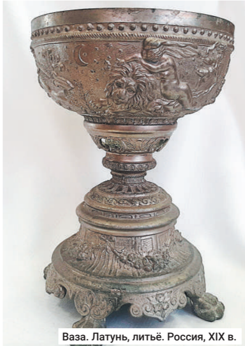
Ваза. Латунь, литьё. Россия, XIX в.