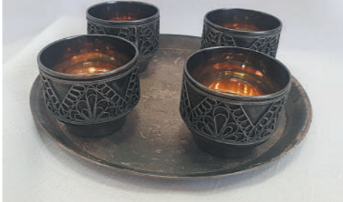
Набор коньячный. Мельхиор, скань, посеребрение. СССР, 1970-е гг.