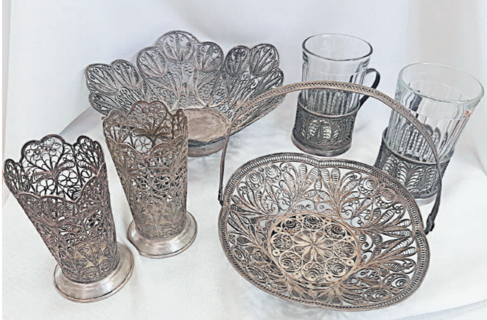
Набор посуды. Металл, проволока, скань. СССР, 1950-е гг.

рань) – одна из древнейших ювелирных техник, которая была известна на Руси еще с IX-X веков. Ювелиры использовали тонкую скрученную проволоку из золота, серебра или меди и превращали ее в ажурный или напаянный на металл узор. В XIX веке в России создавались целые фабрики скани. Производили в основном шкатулки, вазы, посуду, предметы для дамского будуара, церковную утварь. Несмотря на промышленные масштабы, каждое изделие мастера изготавливали вручную.