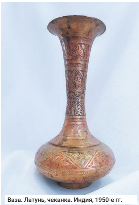
Ваза. Латунь, чеканка. Индия, 1950-е гг.