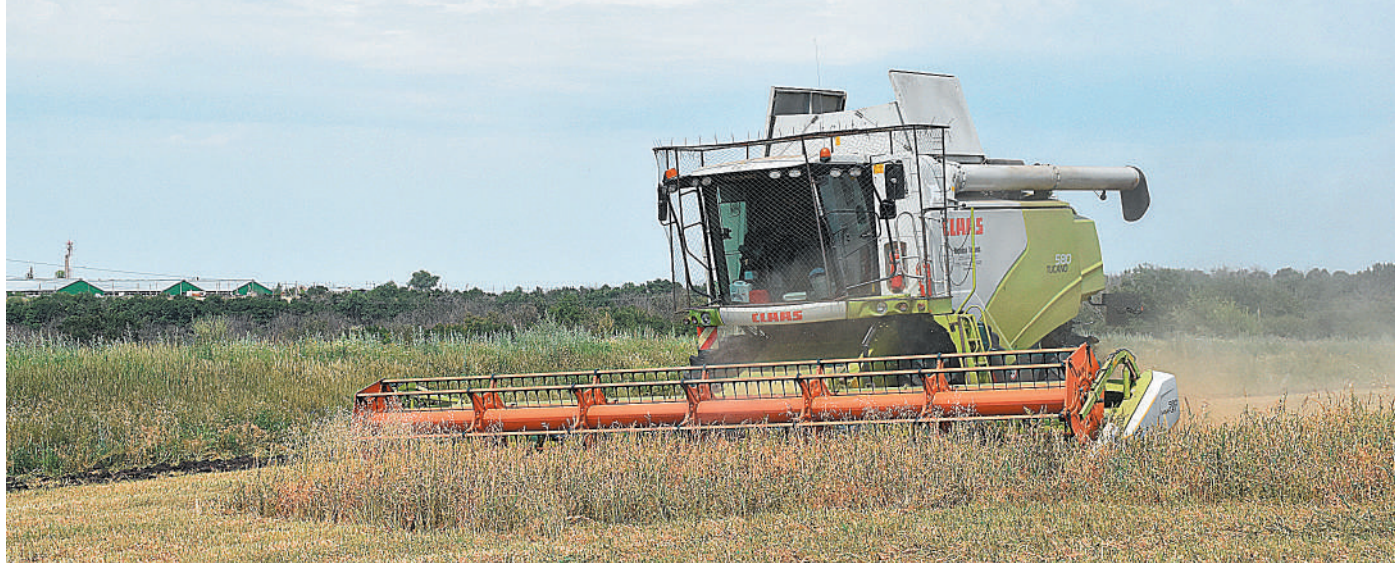
Комбайны оборудованы антидроновой защитой

ВАЛУЙСКИЕ ЗЕМЛЕДЕЛЬЦЫ ПРИСТУПИЛИ К СТРАДЕ ПРИ ПОВЫШЕННЫХ МЕРАХ БЕЗОПАСНОСТИ