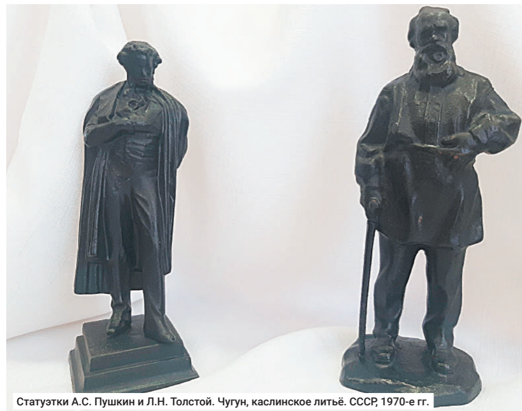
Статуэтки А.С. Пушкин и Л.Н. Толстой. Чугун, каслинское литьё. СССР, 1970-е гг.