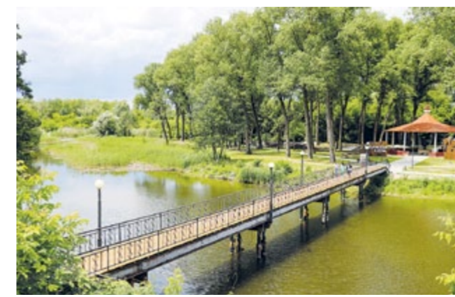
Любимое место отдыха грайворонцев

ние самой реки приписывать государю. Дескать, когда Пётр I уронил в воду стекло от подзорной трубы, то воскликнул: «Вор стекла!», так и прозвали реку. Может, государь тут и не прогуливался, но вряд ли найдётся хотя один грайворонец, который никогда не совершал променадов по «Петровской круче». Несмотря на то что здесь долгие годы находился обычный лесопарк, частично заросший и неблагодарный, горожане с удовольствием бродили вдоль реки, устраивали народные гуляния и пикники.