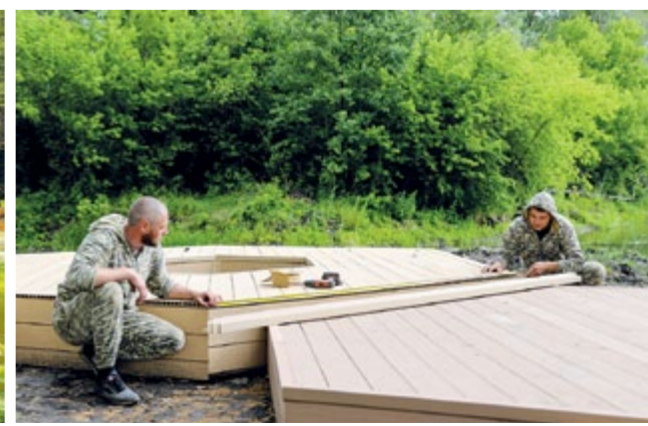
Рабочие укладывают деревянные соты