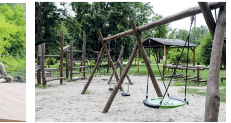
Детскую площадку сделали из экоматериалов