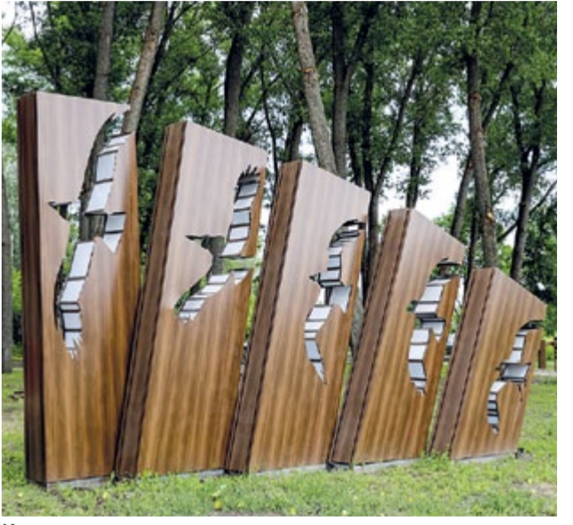
Композиция с воронами – отсылка к названию города

Благоустройство ЕЩЁ ПЯТЬ лет назад территорию рядом с рекой Ворсклой можно было считать зоной отдыха весьма относительно. Здесь были лишь грунтовые тропинки, заросли камышей, старые сухостойные деревья и прочий скупострой. Однако люди всё равно приходили сюда прогуляться и отдохнуть, как и многие поколения грайворонцев до них. А когда настало время выбрать место для реконструкции по федеральному проекту «Формирование комфортной городской среды», люди единогласно проголосовали за то, чтобы привести в порядок именно этот участок у Ворсклы. Их желание осуществилось, да ещё и неоднократно.