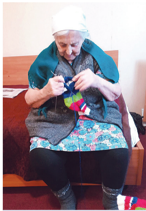
Журавлёвские бабушки вяжут солдатам носки и шарфы.

первую помощь раненым. А стиральные машины работали в домах односельчан почти без перерыва, чтобы обстирать наших защитников.