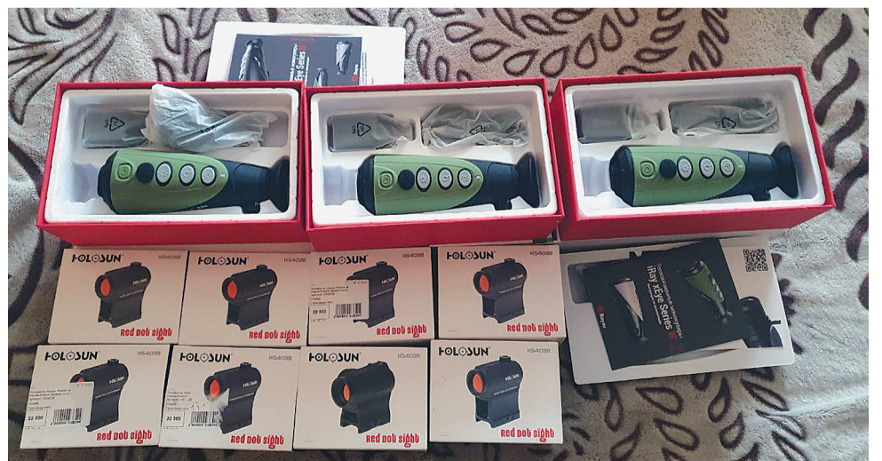
В списке заказов у волонтеров тепловизоры, приборы ночного видения, прицелы для оружия и даже квадрокоптеры.