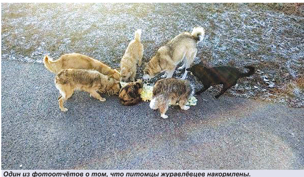
Один из фотоотчётов о том, что питомцы журавлёвцев накормлены.