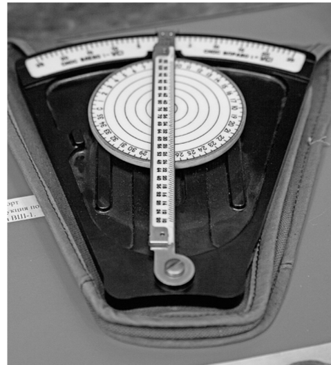
Часть интерактивной экспозиции.