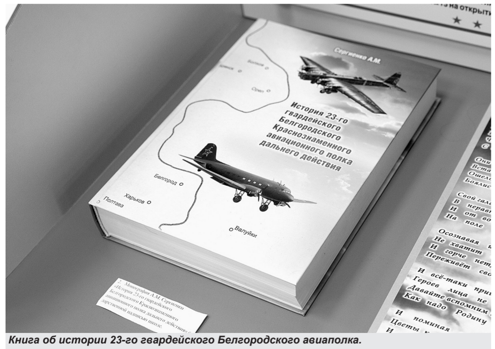
Книга об истории 23-го гвардейского Белгородского авиаполка.