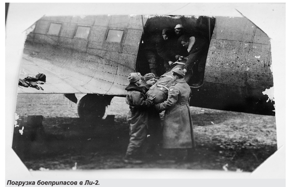
Погрузка боеприпасов в Ли-2.

«Наша машина загорелась на втором заходе, уже при отходе от цели. Командир экипажа приказал прыгать. Все, кто мог, выпрыгнули... При наборе скорости свободного падения меня стало крутить. Левую руку пружало к бедру, и я ощутил кольцо. Я его потянул, и парашют раскрылся. Только принял нормальное положение, как заметил немецкого истребителя. Он дал по мне очередь, но промахнулся. Иду на хитрость: опускаю