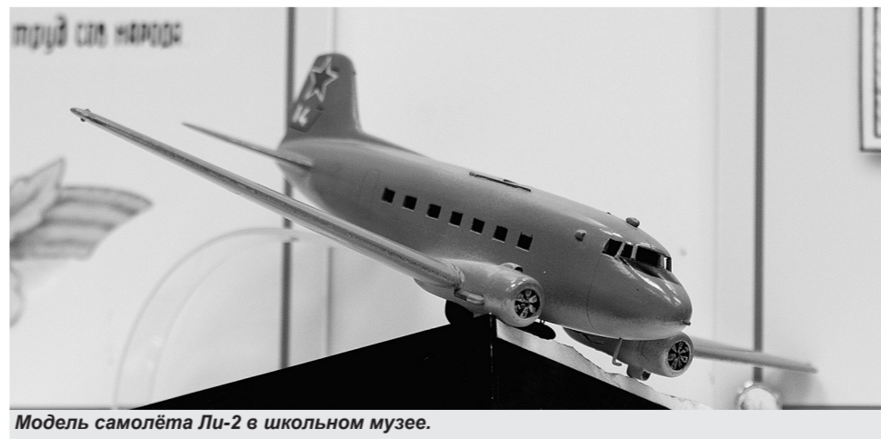
Модель самолёта Ли-2 в школьном музее.

Разве не 23-й гвардейский авиаполк АДД носит имя этого города?