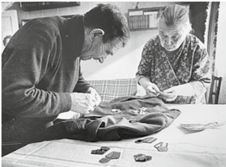
«Папа и мама всё делали вместе»