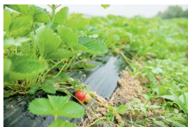
«Посадочный материал предприниматель приобрёл на средства гранта»

У НАС ЭТА НИША СВОБОДНАЯ, ПЕРСПЕКТИВНАЯ И ВПОЛНЕ РЕНТАБЕЛЬНАЯ. КЛУБНИКА СТАЛА ДЕЛОМ МОЕЙ ЖИЗНИ.