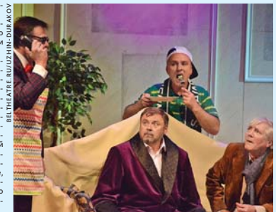
БЕЛГОРОДСКИЙ ДРАМАТИЧЕСКИЙ ТЕАТР ВПЕРВЫЕ ПОКАЗАЛ СПЕКТАКЛИ В САНКТ-ПЕТЕРБУРГЕ

«Наш зритель искушен, консервативен, непредвзвучен. Уверен, что правильно выбрана площадка: с одной стороны, Молодёжный — театр, сохраняющий традиции русского психологического театра, с другой — театр уникальный, где рождаются разные эксперименты, формы. У него есть свой зритель. Это и один из рекордсменов в городе по количеству показов спектаклей в год. Мы выражаем искреннюю поддержку нашим коллегам — деятелям культуры Белгородской области, которые, превозмогая тяжёлые обстоятельства, занимают творчеством, думают о том, что важно и необходимо сейчас людям, — добавил он».