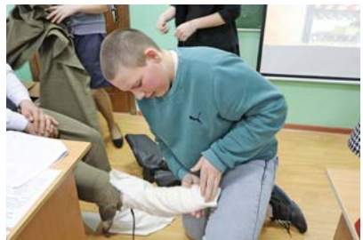
Ребята с удовольствием соревнуются в наматывании портянок на скорость