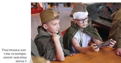
Участники квеста осматривают макеты мин