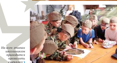
На всех этапах школьникам приходится проявлять смекалку

классов в таком снаряжении неудобно, поэтому для них выдают пилотки, а задания подбирают полегче.