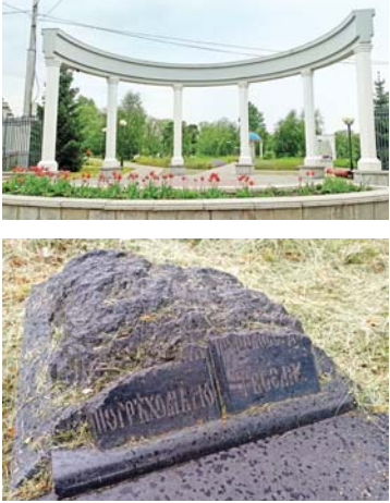
Главный вход на кладбище со стороны улицы Попова

— Но лет через 50, пожалуй, в землю лечь у нас будет уже невозможно, — делат экскурсовод футурологический прогноз. — В США соотношение погребённых в земле и крематориях когда-то было 80 % на 20 %, сейчас стало ровно наоборот. Причина — нехватка земли и, как следствие, высокая стоимость ритуала.