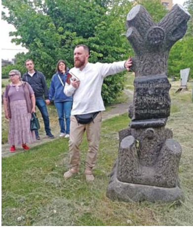
Дендральное надгробие, 1906 год