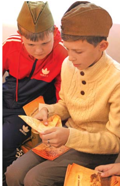
На «фронтон» участники «КМБ» получают пилотку и плащ-палатку для прохождения задания

Недавно в музее появилась новая программа — «Солдатская смекалка». Её разработали для учащихся средних и старших классов. Во время этой образовательной игры ребята знакомятся с полевой кух-