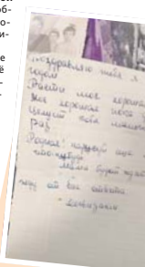
«Воспитанники поддерживали связь с родителями через письма»