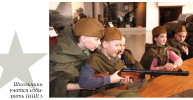
Школьники учатся собирать ПШШ

Все программы длятся от 30 минут до часа, готовые проекты адаптируются под разные возрастные категории. Так, один из традиционных проектов «Курс молодого бойца» предназначался для школьников среднего и старшего возраста. Но потом пошла просьба — сделать «КМБ» и для малышей. По сценарию, вначале бойцы получают обучающее задание: пилотку и плащ-палатку. Учащимся младших