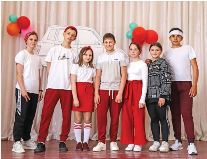
«Золотой запас» — финалист высшей Юниор-Лиги КВН Белгородской области

«С ребятами знакомая ещё с первого класса — знала способности каждого. В команду отоб-