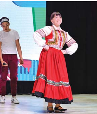
Жизнелюбные танцы и отбивки — изюминка команды КВН Красненского района»

✓ А ВЫ И НЕ ЗНАЛИ • ОТКУДА ПРОИЗОШЛО ВЫРАЖЕНИЕ «БИТЫЙ ЧАС»