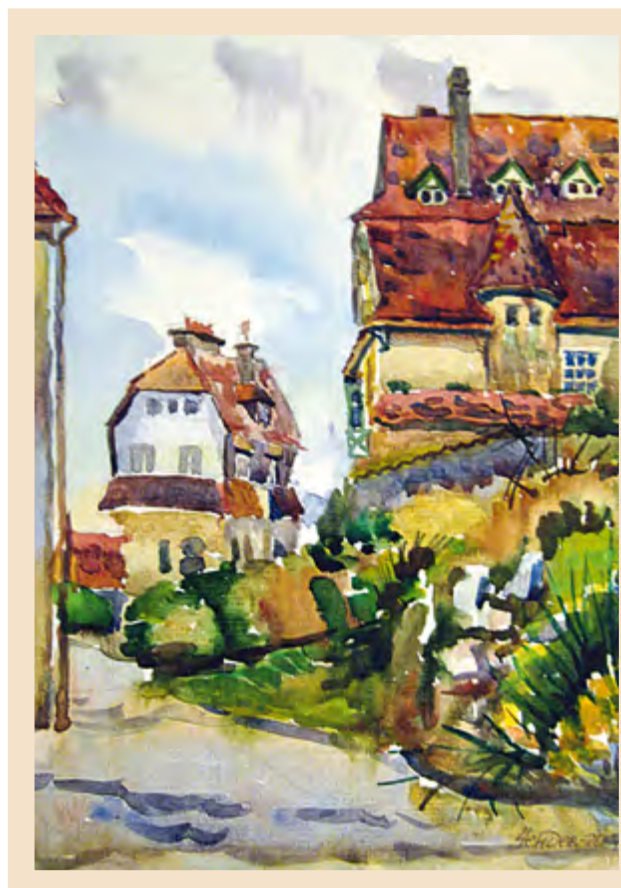
Франция, город Харделот