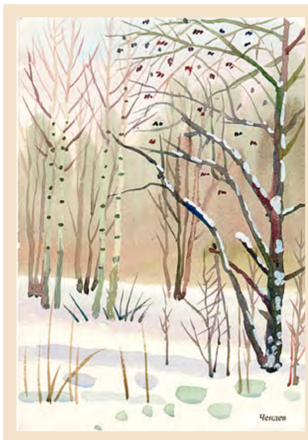
Ольха и берёзы