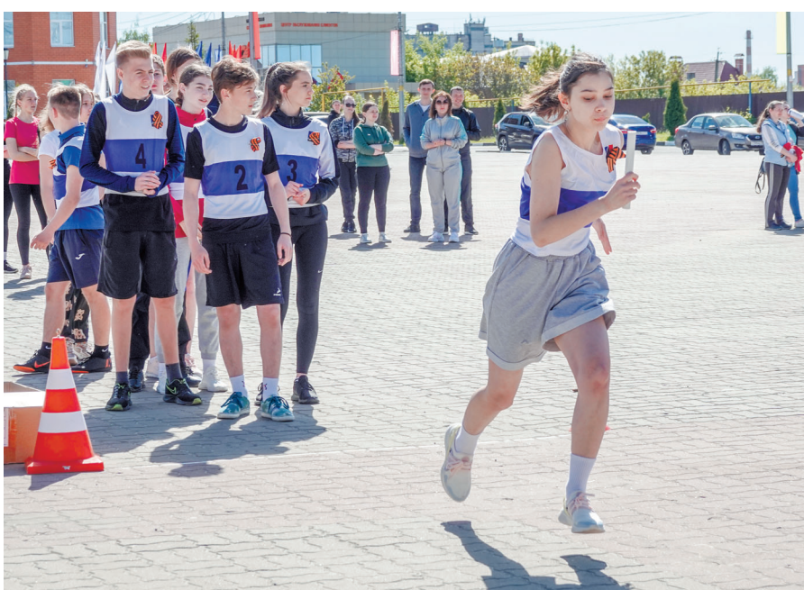
Легкоатлетическая эстафета, посвящённая 77-й годовщине Победы в Великой Отечественной войне, прошла в Чернянке. Участие приняли 10 команд.

На призыв управления физической культуры, спорта и молодёжной политики активно откликнулись не только дети, но и представители трудовых коллективов. Участниками стали четыре команды общеобразовательных школ, представители техникума, эстафету поддержали администрация района и команды управлений образования, социальной защиты населения, культуры, физической культуры, спорта и молодёжной политики, в каждой — по 12 человек.