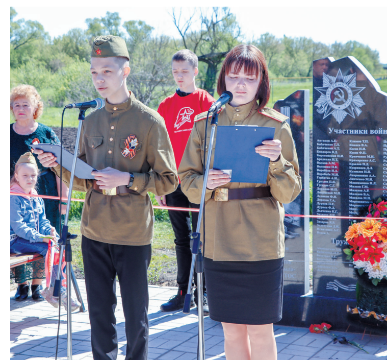
Аллею «Сирень Победы» торжественно открыли в преддверии 9 Мая.

— Патриотизм с этого и начинается — с любви к своим предкам. Ведь посмотрите, даже спустя столько десятилетий мы знаем об их подвигах и чтим память делов и прадедов, героически защищавших Родину. Это та нить, которая связывает всех нас. Она кровью прошла почти через каждую семью. И такие вещи, как этот солдатский медальон — это пример того, как через много