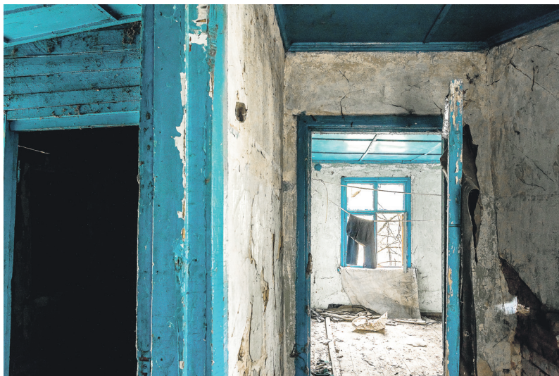
Так сегодня выглядит дом, в котором жил Александр Филатов