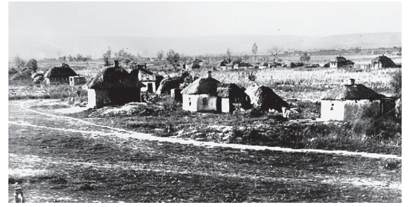
Разумное, 1946 год. На переднем плане – битый кирпич от разрушенной церкви