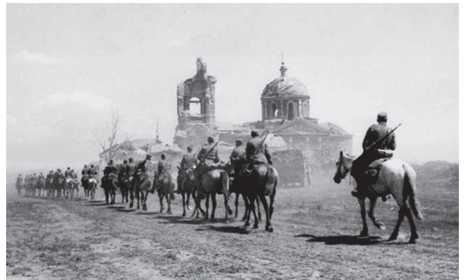
Лето 1943 г. На заднем плане – Свято-Николаевская церковь в Разумном