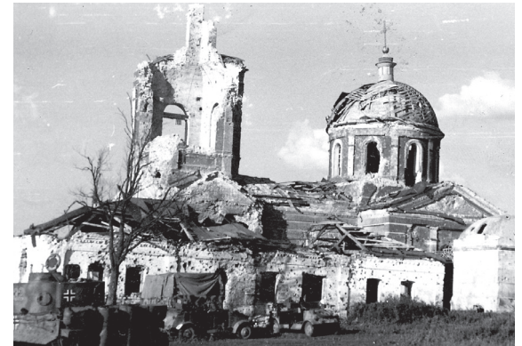
Разумное в период гитлеровской оккупации