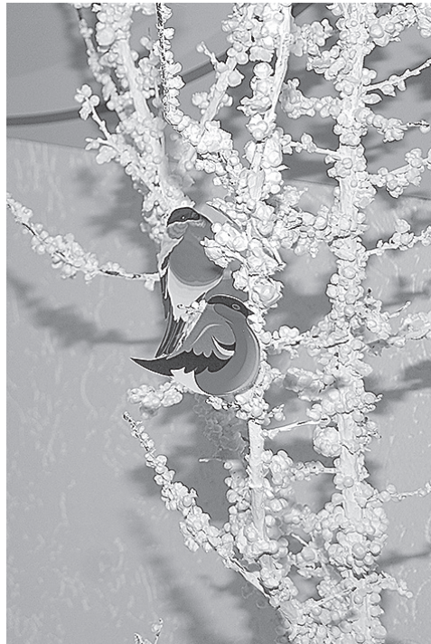
Украшение Центральной районной библиотеки

– Современный человек больше озабочен своими бытовыми проблемами и вопросами. Нас сильнее накрыл технический прогресс и