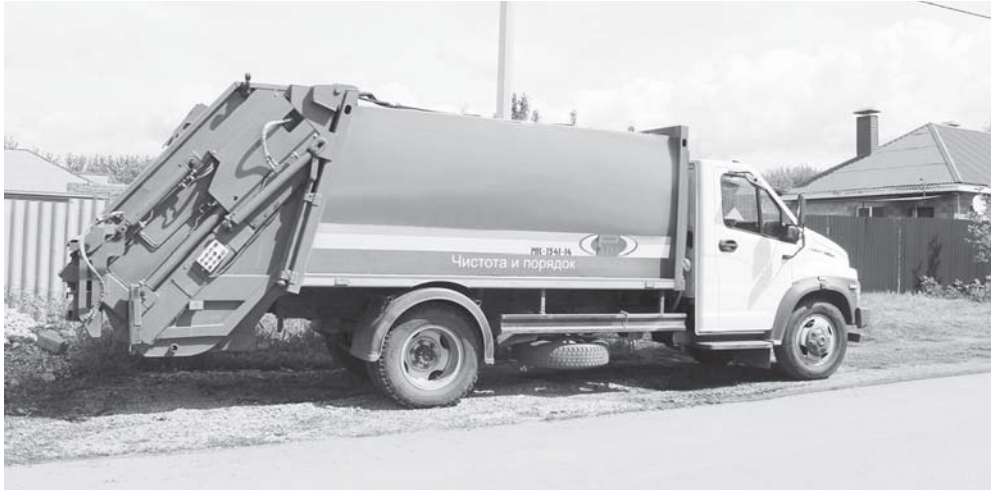
Самая ожидаемая спецтехника в райцентре выглядит именно так

КАК В ИВНЕ НАМЕРЕНЫ ОРГАНИЗОВАТЬ СБОР МУСОРА ПО УЛИЦАМ