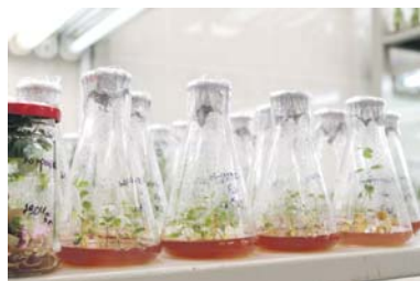
Для каждого растения в пробирке подбирался световой спектр

НА СЕГОДНЯ НОЦ ОБЪЕДИНИЛ ВОСЕМЬ ВУЗОВ, 20 НАУЧНЫХ ОРГАНИЗАЦИЙ И ДЕСЯТЬ ПРОИЗВОДСТВЕННЫХ ПРЕДПРИЯТИЙ. ИХ СИМБИОЗ ОКАЗАЛСЯ ОЧЕНЬ ЭФФЕКТИВНЫМ — В ПОРТФЕЛЕ 31 ПРОЕКТ.