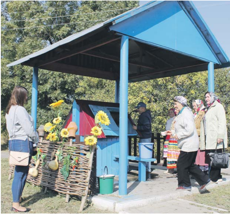
▲ Колодец в центре села Солдатское не бывает безлюдным

КЛЮЧЕВАЯ ВОДА ЖЕ ОТ ВСЕХ БОЛЕЗНЕЙ ПОМОГАЕТ. УТРОМ, ПЕРЕД ЗАВТРАКОМ, ОБЯЗАТЕЛЬНО ВЫПИВАЕМ СТАКАНЧИК.