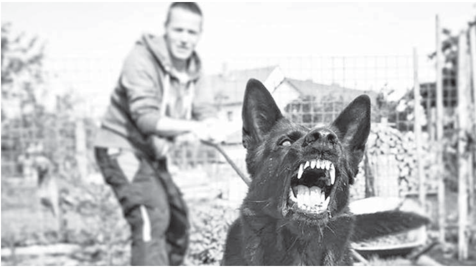
«Закон запрещает выгул потенциально опасных собак без намордника и поводка»