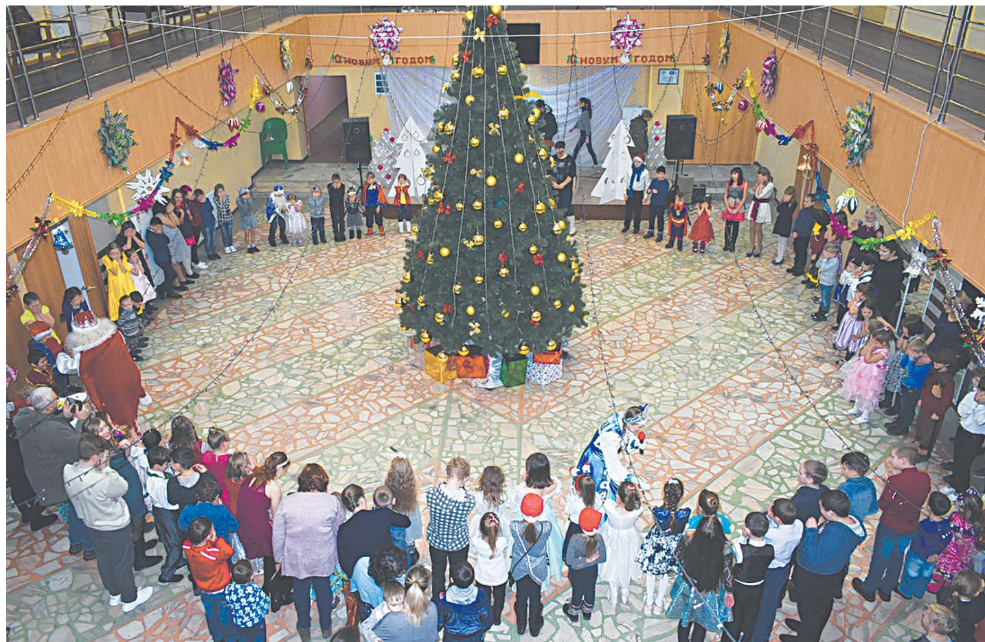
Многолюдно и сказочно было на праздничной ёлке главы администрации района

ВЕСЁЛЫМИ УТРЕННИКАМИ И ТЕАТРАЛИЗОВАННЫМИ ПРЕДСТАВЛЕНИЯМИ