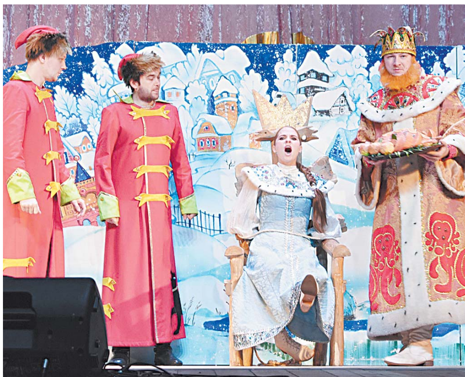
Сцена из спектакля-сказки "По щучьему велению", поставленного актёрами Белгородского драматического театра имени М.С. Щепкина