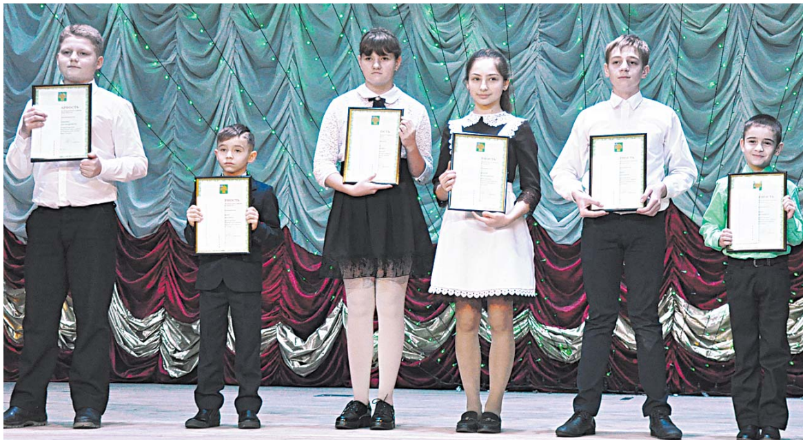
Лауреаты премии «Молодые таланты ровенской земли-2019» в номинации «Спорт»